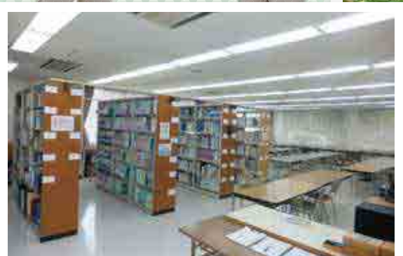
◆◆ 図書室 ◆◆