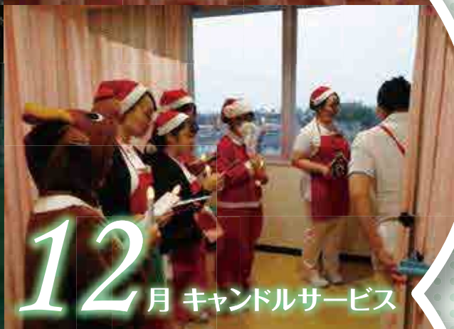
12月 キャンドルサービス