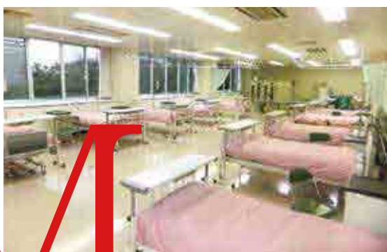
◆◆◆ 看護実習室 ◆◆◆