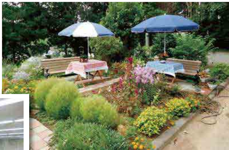
◆◆ 宮看ガーデン ◆◆