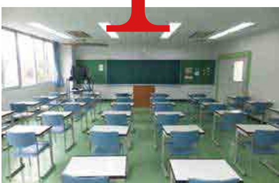
◆◆◆ 教室 ◆◆◆