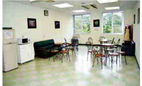
◆◆◆ 学生ホール ◆◆◆