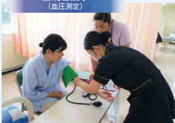
基礎看護学 (血圧測定)