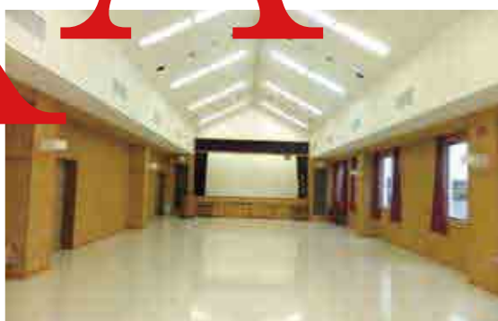
◆◆ 講堂 ◆◆