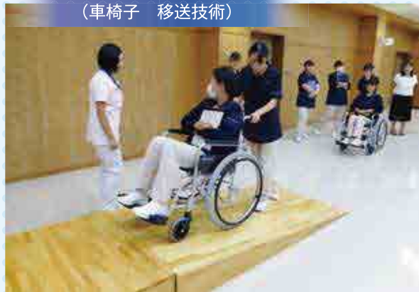
基礎看護学 (車椅子 移送技術)