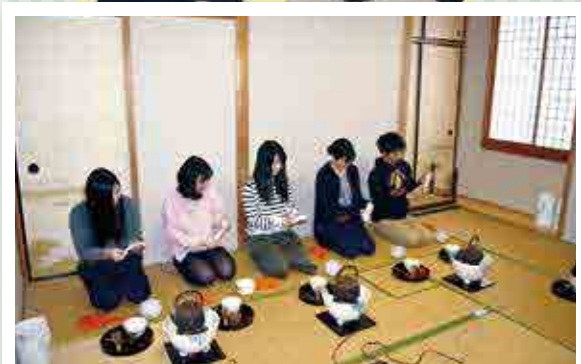
◆◆ 茶室 ◆◆