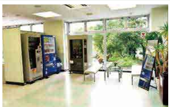
◆◆ 玄関ホール ◆◆