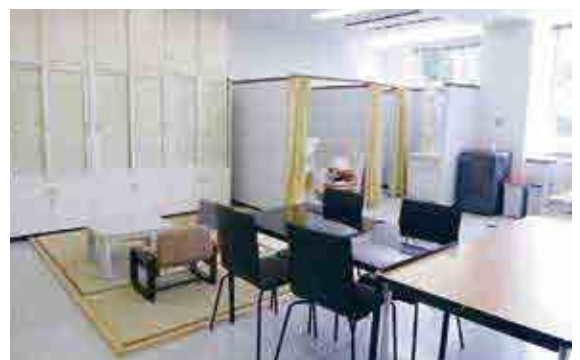
◆◆◆ 在宅看護実習室 ◆◆◆