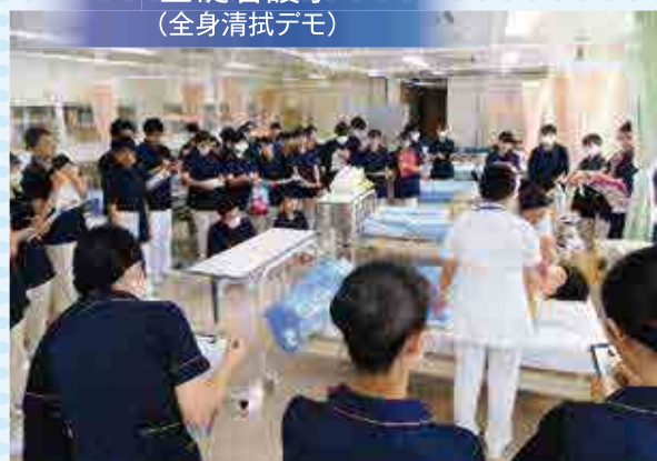
基礎看護学 (全身清拭デモ)