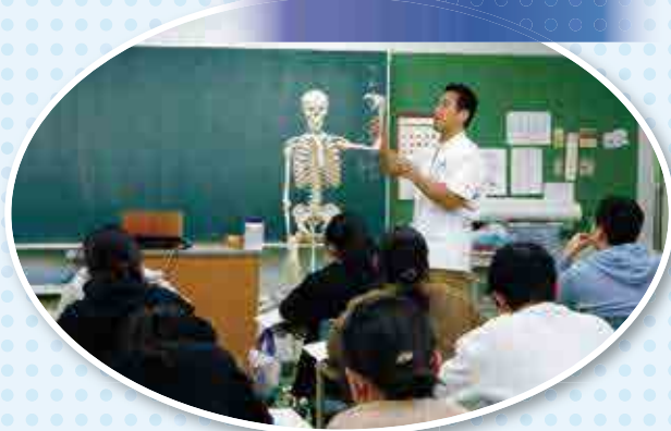
医師による解剖生理学