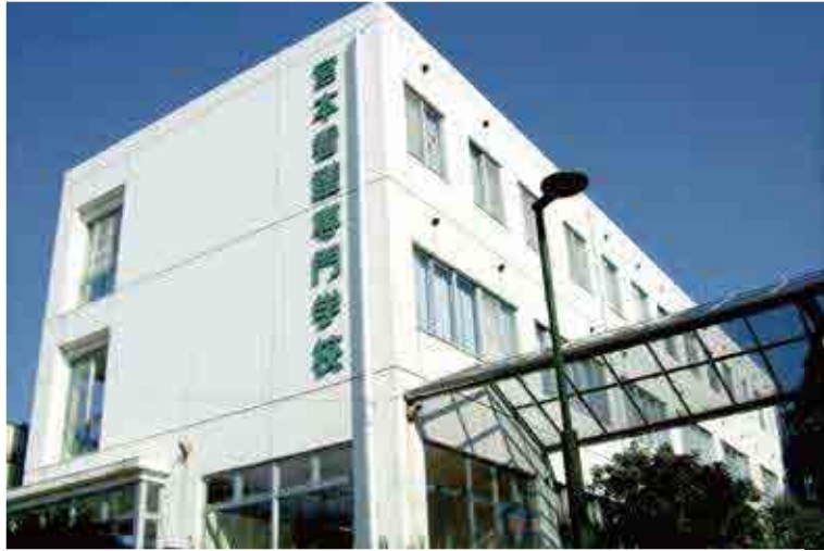
◆◆◆ 学校外観 ◆◆◆