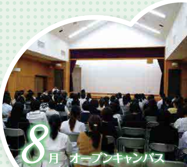
8月 オープンキャンパス