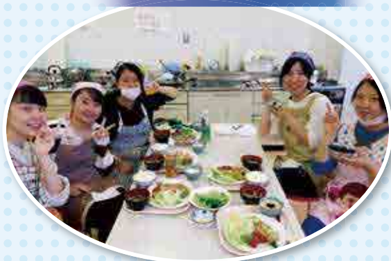
管理栄養士による栄養学 (調理実習)