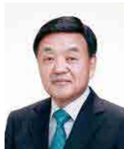
宮本看護専門学校学校長 宮本病院 病院長